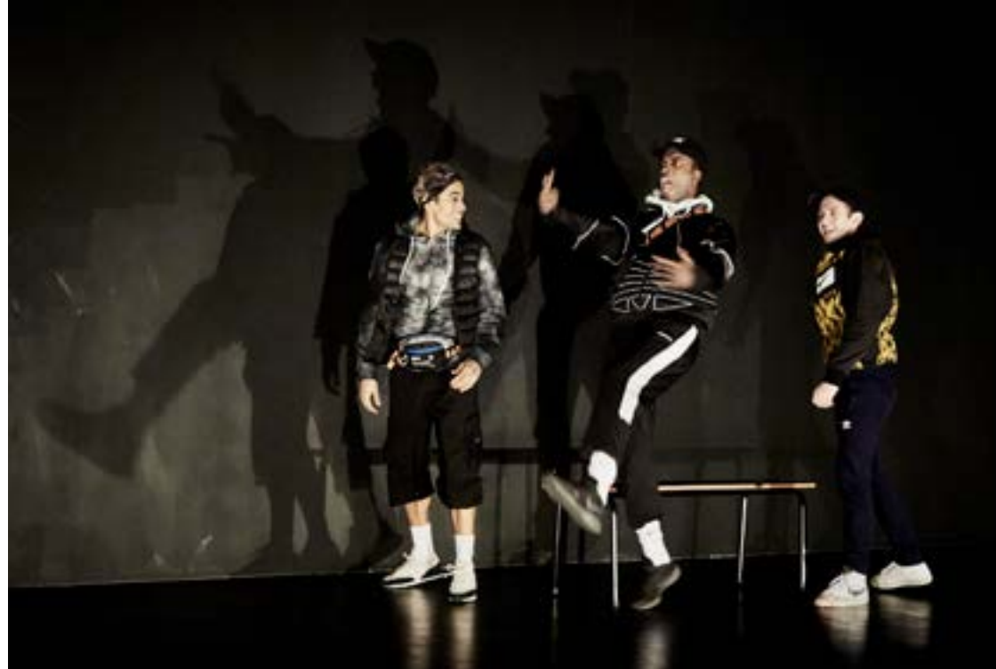
Brûlé.e.s - Création au 104-Paris