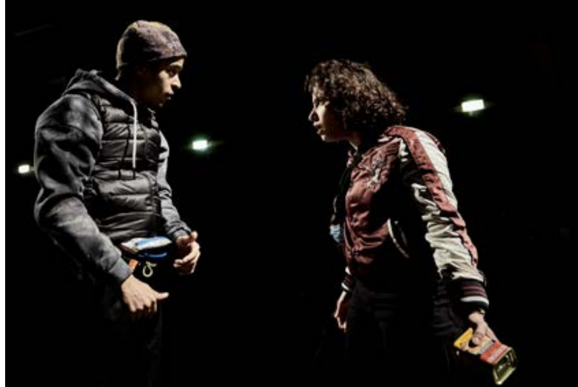
Brûlé.e.s - Création au 104-Paris