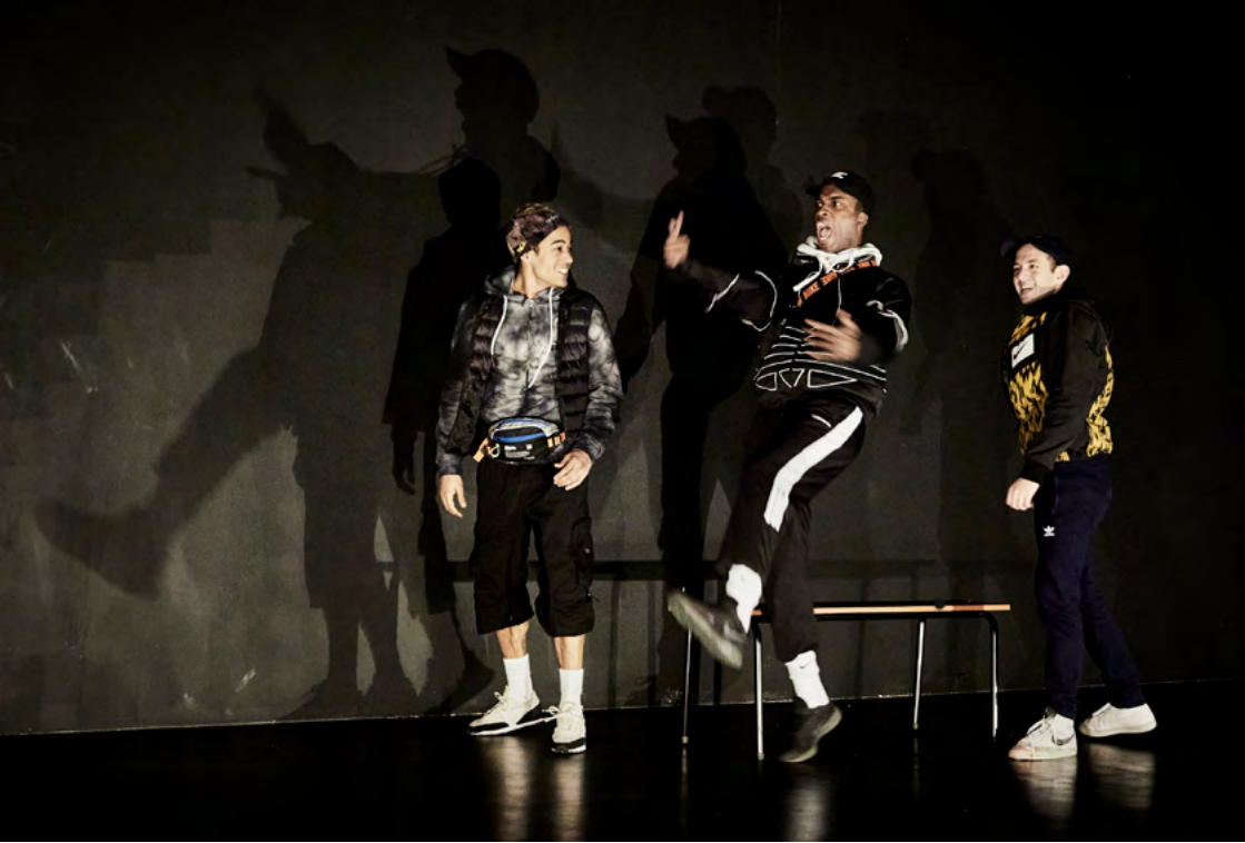
Brûlé.e.s - Création au 104-Paris