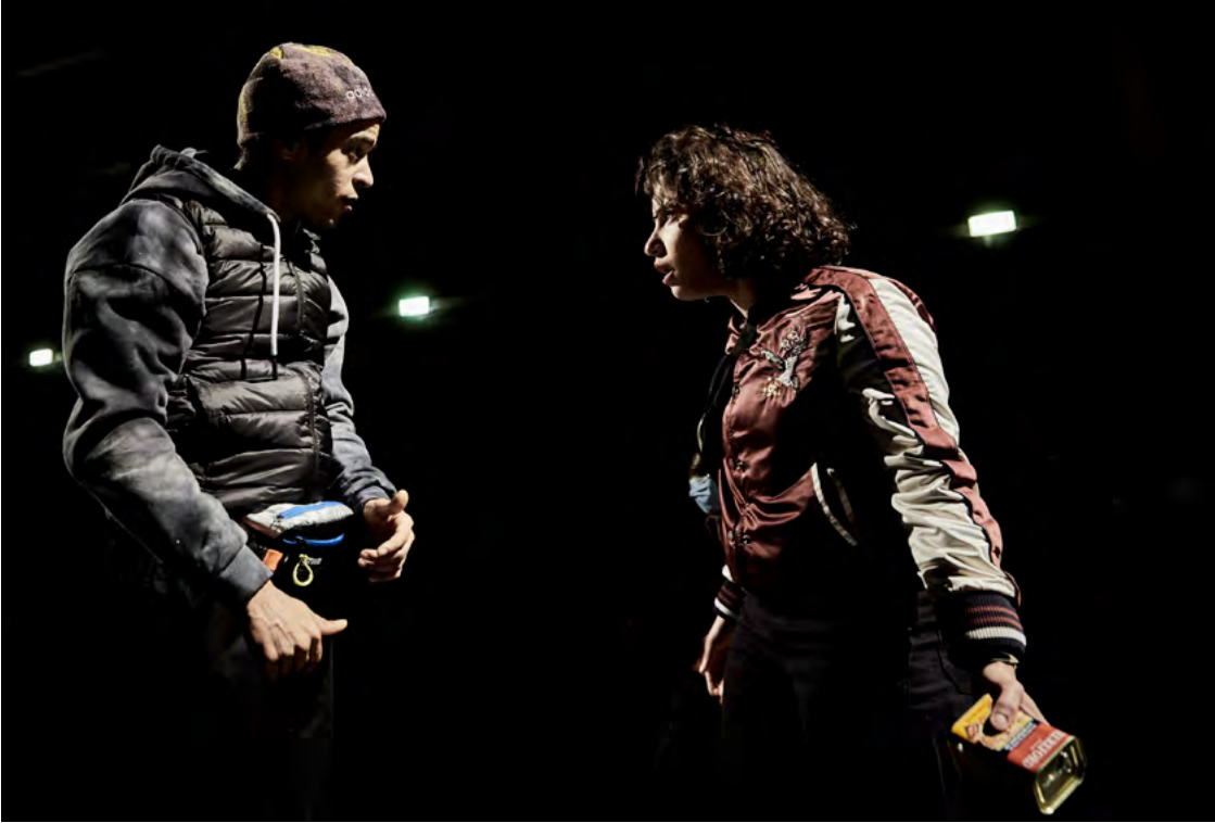
Brûlé.e.s - Création au 104-Paris